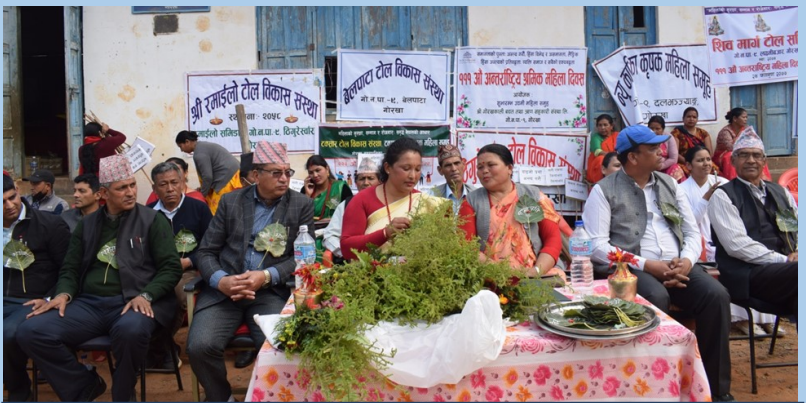
महिला दिवसको अवसरमा गोरखामा भएको अन्तर्क्रिया कार्यक्रम