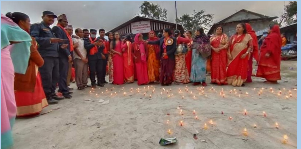
ओखलढुंगाको मोलुङ गाउँपालिकामा महिला दिवसको अवसरमा गरिएको दिप प्रज्वलन