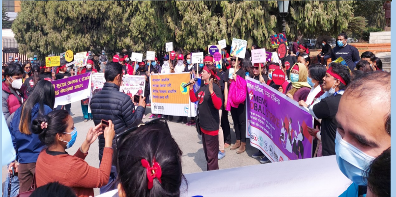
काठमाण्डौमा भएको च्याली पश्चात भएको रभामा सम्बोधन गर्दै अधिकार कर्मिहरु